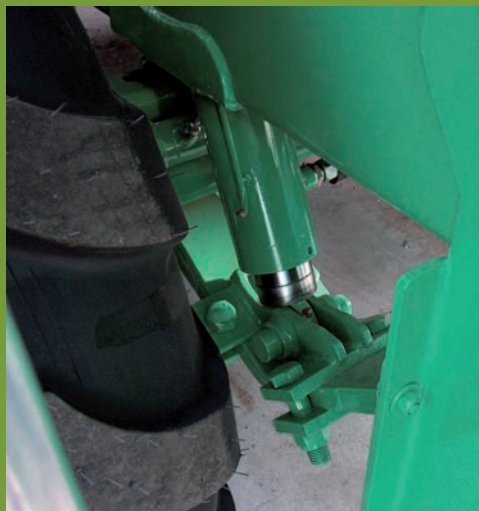
SUSPENSIÓN HIDRÁULICA HYDRAULIC SUSPENSION