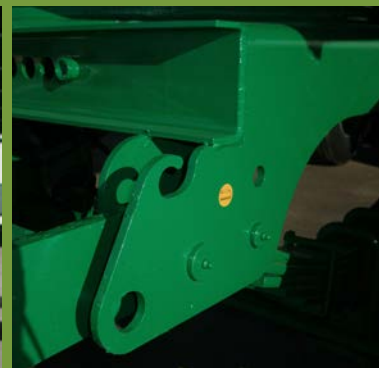
GIRATORIO MODULAR MODULAR REVOLVING SYSTEM