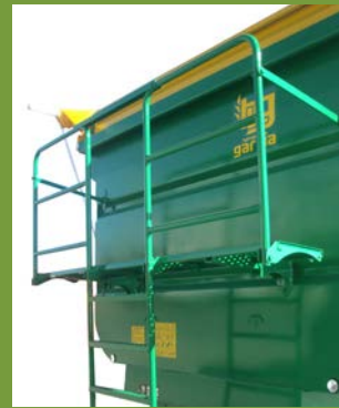
BALCONCILLO DELANTERO FRONT SMALL BALCONY