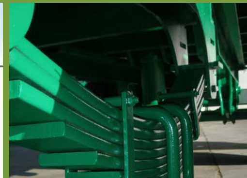
BALLESTA MULTIHOJA Y ABARCONES REFORZADOS MULTSPRINGS SUSPENSIÓN AND REINFORCED U-BOLTS