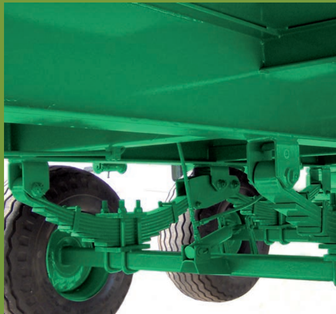
TANDEM AGRÍCOLA AGRICULTURAL TANDEM