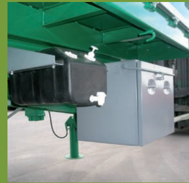
DEPÓSITO Y CAJÓN DE HERRAMIENTAS WATER TANK AND TOOL BOX