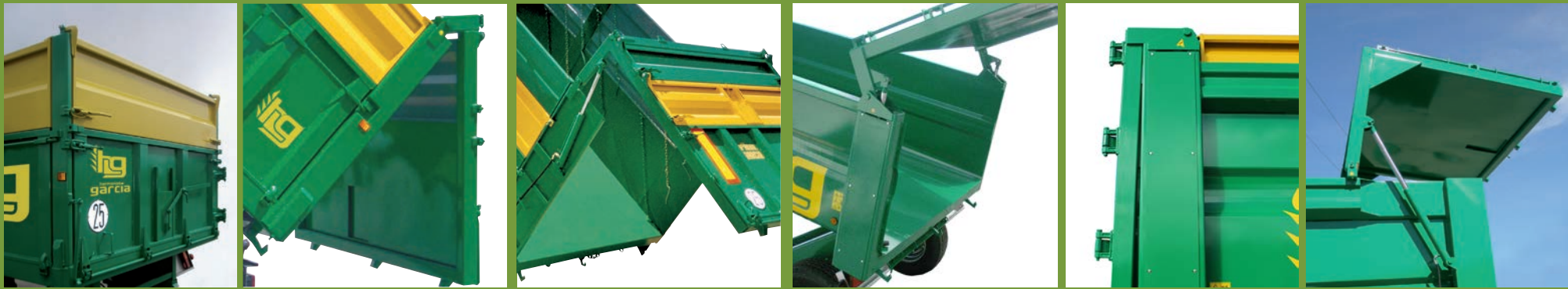
CIERRE 3 POSICIONES 3 POSITIONS LOCK