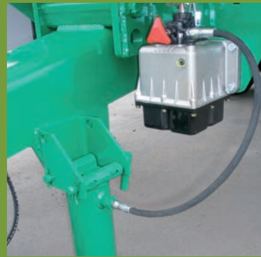
APOYO HIDRÁULICO Y BOMBA MANUAL HYDRAULIC SUPPORT AND MANUAL PUMP