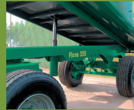
CHASIS DE ACERO FLEXA 355 FLEXA 355 STEEL CHASSIS