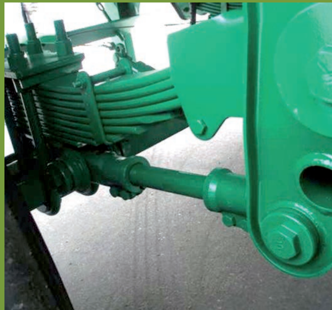
TANDEM TENSORES TANDEM WITH TENSORS