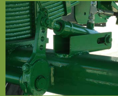
LEVAS REGULABLES ADJUSTABLE CAMS