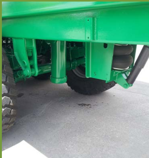
SUSPENSIÓN NEUMÁTICA PNEUMATIC SUSPENSION