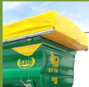
LONA LONGITUDINAL LONGITUDINAL CANVAS