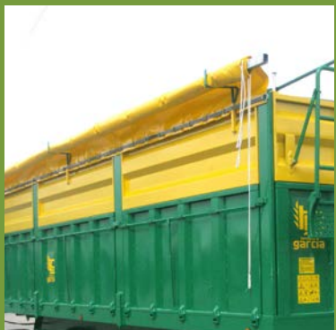
LONA BARRA LATERAL CANVAS LATERAL BAR