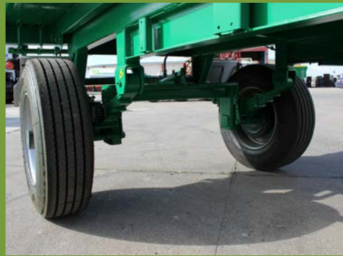
EJE CURVO CURVED AXLE