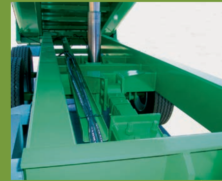
CHASIS DE TUBO TUBULAR CHASSIS