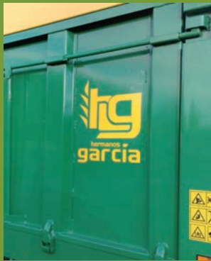
CIERRE DE BARRA TIR LOCK