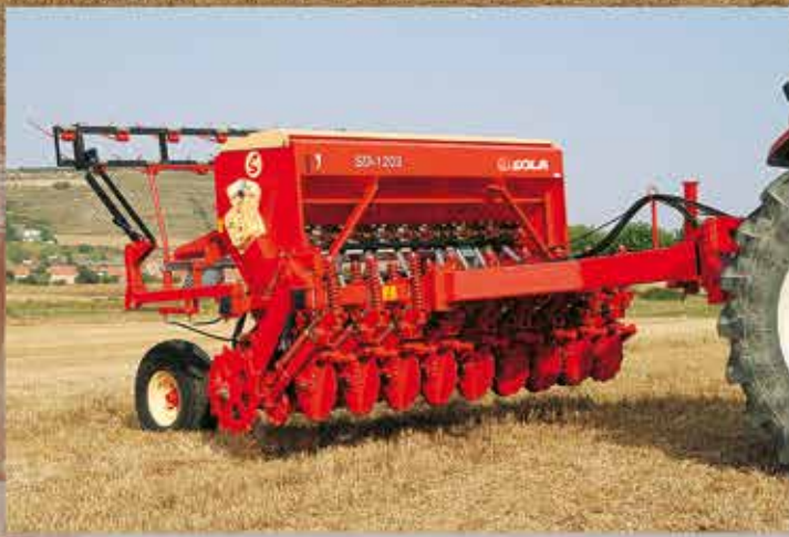
-ALZAMIENTO DE LA MÁQUINA PARA EL TRANSPORTE.