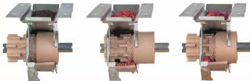
SEMILLAS FINAS. (ALFALFA, COLZA...)