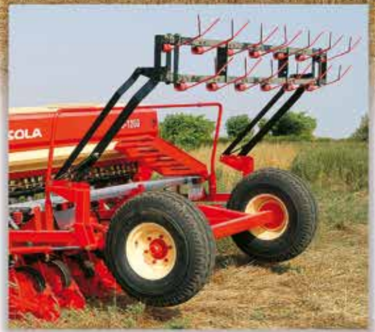
-RASTRA TRASERA CON PLEGADO HIDRÁULICO PARA EL TRANSPORTE.