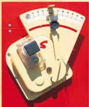
-VARIADOR DE VELOCIDADES.