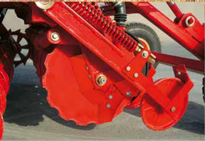
-CONJUNTO DE DISCO, BOTA Y RUEDA COMPACTADORA.