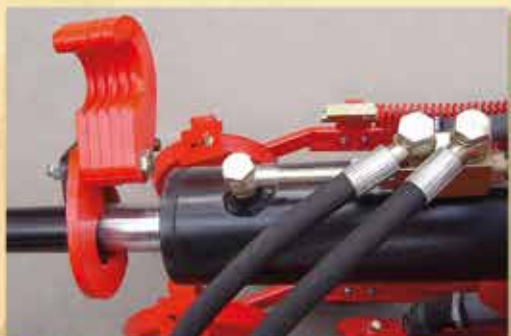
TOPES REGULABLES PARA VARIAR EL PESO DE LA MÁQUINA SOBRE LOS DISCOS ABRIDORES.