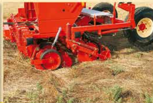
-DETALLES DE SIEMBRA BAJO CUBIERTA VEGETAL.